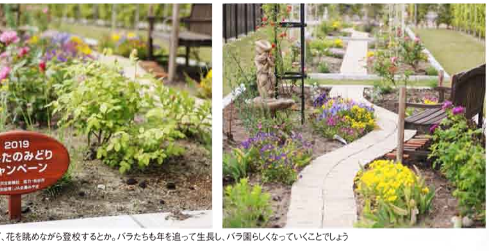
小学生たちが、花を眺めながら登校するとか、バラたちも年を過して生長し、バラ園らしくなっていくことですよ。