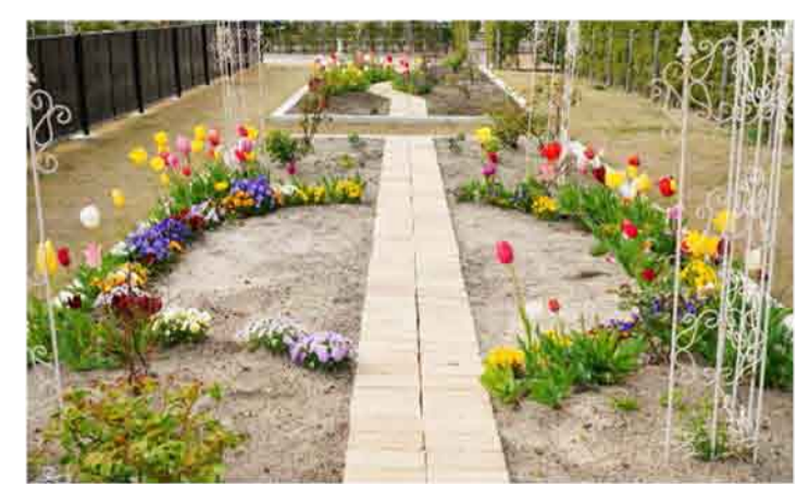
花壇の真ん中にはレンガを敷いた通路を設けています。通路があることで花壇の中に入ることなく雑草を取ることが可能です。