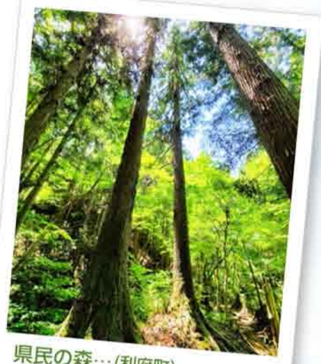
県民の森... (利府町) 周りが森に囲まれ、宮城県内で神秘的な場所の一つ。 (2020年6月)