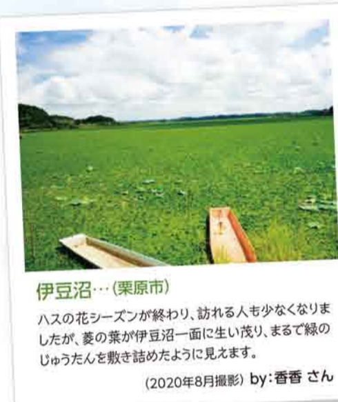
伊豆沼... (栗原市) ハスの花シーズンが終わり、訪れる人も少なくなりましたが、菱の葉が伊豆沼一面に生い茂り、まるで緑のじゅうたんを敷き詰めたように見えます。 (2020年8月撮影) by:香香さん