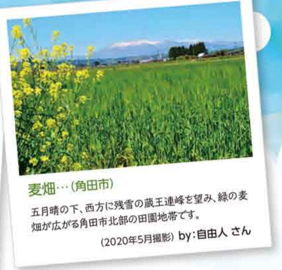
麦畑... (角田市) 五月晴の下、西方に残雪の蔵王連峰を望み、緑の麦畑が広がる角田市北部の田園地帯です。 (2020年5月撮影)