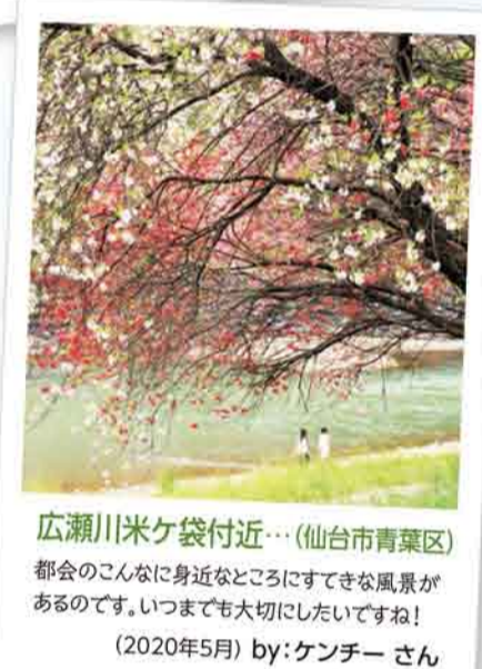
広瀬川米ヶ袋付近... (仙台市青葉区) 都会のこんなに身近なところにすてきな風景があるのです。いつまでも大切にしたいですね! (2020年5月)