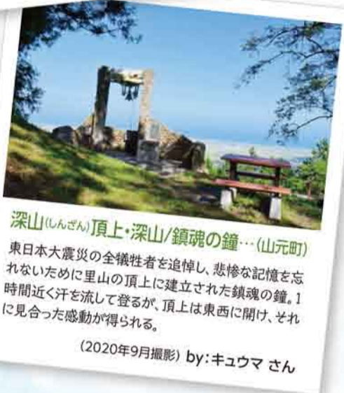
深山(しんぜん)頂上・深山/鎮魂の鐘... (山元町) 東日本大震災の全犠牲者を追悼し、悲惨な記憶を忘れないために里山の頂上に建立された鎮魂の鐘。1時間近く汗を流して登るが、頂上は東西に開け、それに見合った感動が得られる。 (2020年9月撮影) by:キユウマさん