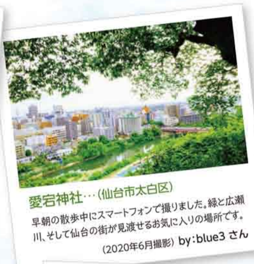
愛宕神社... (仙台市太白区) 早朝の散歩中にスマートフォンで撮りました。緑と広瀬川、そして仙台の街が見渡せるお気に入りの場所です。 (2020年6月撮影)