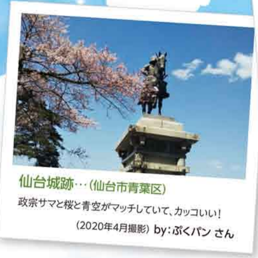
仙名城跡... (仙台市青葉区) 政宗サマと桜と青空がマッチしていて、カッコいい! (2020年4月撮影)