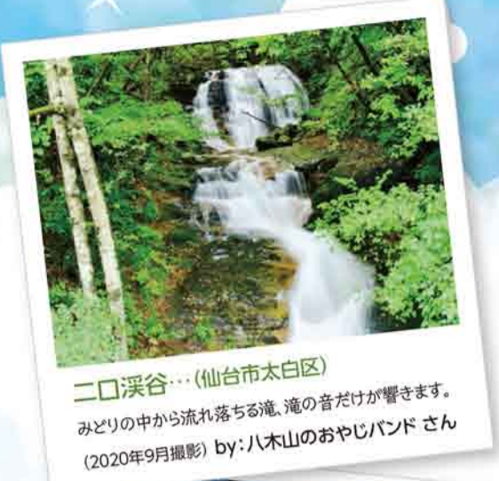
二口渓谷... (仙台市太白区) みどりの中から流れ落ちる滝、滝の音だけが響きます。 (2020年9月撮影)