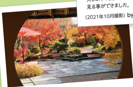
円通院... (松島町) 政宗ゆかりの寺、円通院。庭園は晩秋の柔らかな光に照らされ、窓ごしからの紅葉は一幅の絵を見ているようでした。(2020年11月撮影)