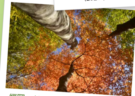
福岡... (白石市) 空を見上げると青空と紅葉がまぶしく輝き、爽やかなひととき。(2021年10月撮影)