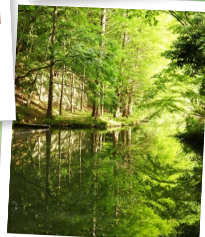
貝ヶ森公園... (仙台市青葉区) 周りに生える数本のメタセコイアが、鏡となった水面に対称に映り、あたかも底がないような神秘的な風景を醸し出している。(2021年6月撮影)