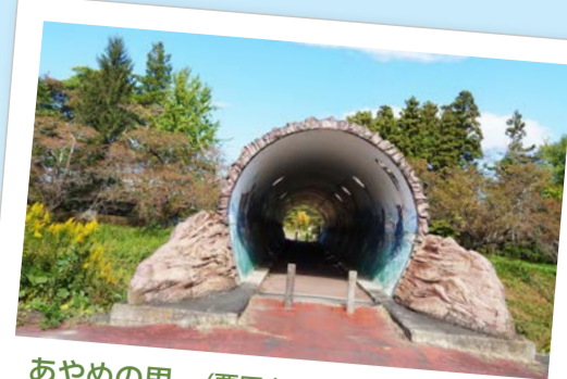
あやめの里... (栗原市) お気に入りの風景です。トンネルを抜けていくと、また違う風景が広がる感じが好きです。(2021年10月撮影)