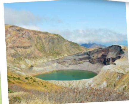
蔵王山御釜... (蔵王町) 久しぶりの蔵王山。エメラルドグリーンの御釜を見ることができました。(2021年10月撮影)