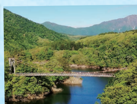
鳴子温泉鬼首 花淵バイパス…(大崎市) 「やたてつり橋」。春夏秋冬、それぞれの美しい風景を見せてくれます。 (2022年6月撮影)