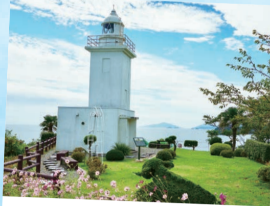
雄勝町の大須崎…(石巻市) 奥に金華山が見え、みどりがきれいな浜の秋風景です。 (2022年9月撮影)