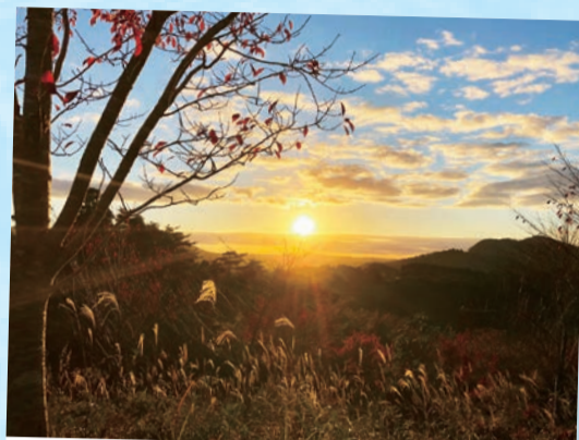
本吉町…(気仙沼市) 小さな山の上から見た夕日が、紅葉した木々を照らしていました。 (2022年10月撮影)