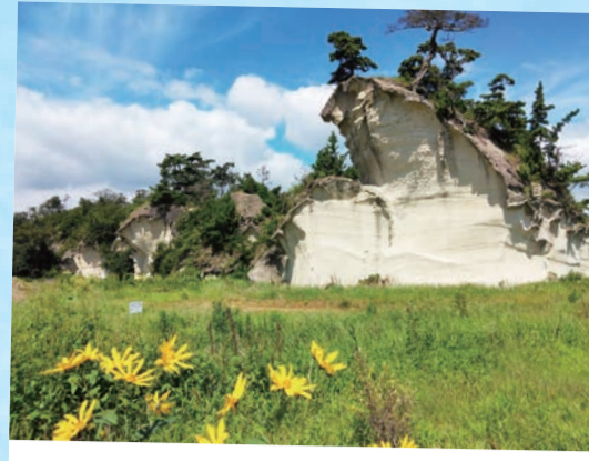
野蒜海岸近くの「鷲ノ巖」…(東松島市) 奇岩の上に松ノ木が…。他にも、いろんな奇岩があるよ! (2022年9月撮影)