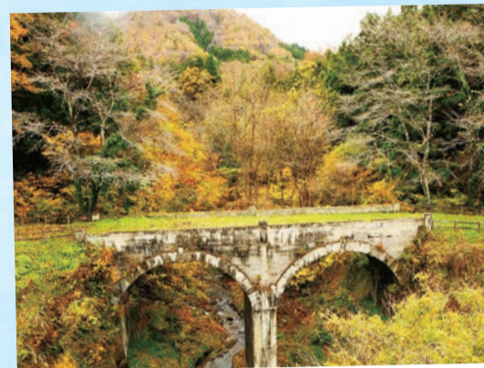
秋保地区…(仙台市太白区) 秋保旧街道のめがね橋です。重厚な雰囲気がかかっていました。 (2021年11月撮影)