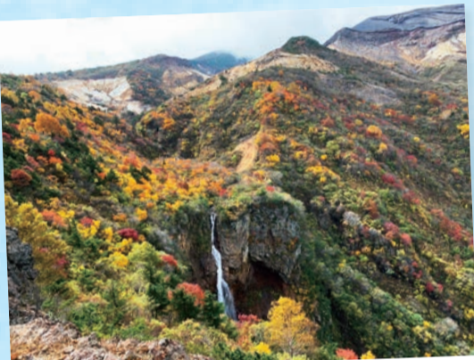
お釜近くの紅葉…(蔵王町) 赤茶けた土と岩がある高台からのせくと、この景色が見える。そのギャップに驚愕。 (2022年10月撮影)