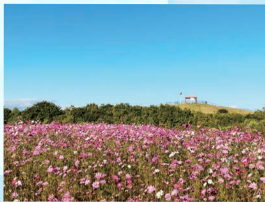
千年希望の丘…(岩沼市) 晩秋のコスモス! (2022年10月撮影)