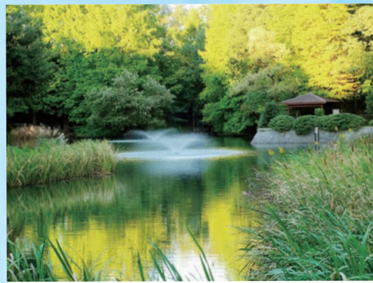
貝ヶ森中央公園…(仙台市青葉区) 紅葉を撮影に行きましたが、まだ紅葉前で緑が噴水に映えていました。 (2022年10月撮影)