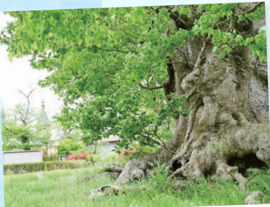
旧金成小学校校庭…(栗原市) 校庭の真ん中に残された巨木、何を見送ったのだろうか。凛とした風格を感じた。 (2022年5月撮影)