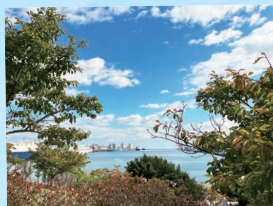
スリーエム仙台港パーク…(仙台市宮城野区) 小高い丘から港が見渡せる。穏やかな港にはフェリーや貨物船が停泊していた。 (2022年10月撮影)