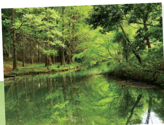
貝ヶ森中央公園…(仙台市青葉区) メタセコイアの深緑と直線的な樹幹が水鏡に映える。春夏秋冬楽しめる場所。 (2022年5月撮影)