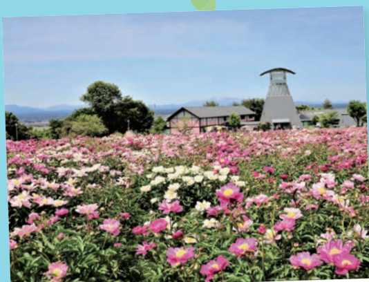
愛宕山公園のシャクヤク畑…(色麻町) 毎年友人と一緒に撮影する場所の一つです。花を近くで見ると、とてもきれいです。 (2023年5月撮影)