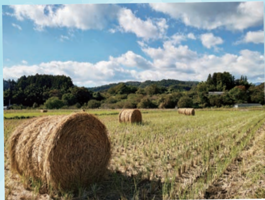
宮地区の田んぼ…(蔵王町) 偶然見られた稲わらロール。これで田んぼの仕事は終わり。こんな風景を楽しめる田舎はいいです。 (2023年10月撮影)