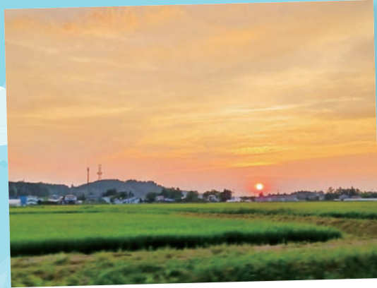
田園…(美里町) みどりの田んぼとあかね色の夕日。 (2023年9月撮影)