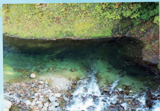
鳴瀬川上流…(加美町) 水がとてもきれいで、みどりに見えます。ぜひ来てください。 (2023年10月撮影)