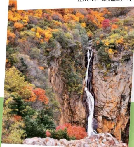
不帰の滝…(蔵王町) 駒草平展望台から見た不帰の滝。紅葉が赤や黄色、オレンジに緑と、色彩豊かに色づきました。 (2023年10月撮影)