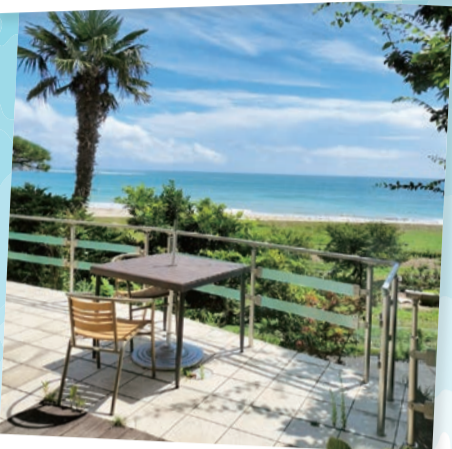
大谷海岸…(気仙沼市) 何度でも足を運びたい至福の場所です。 (2023年8月撮影)