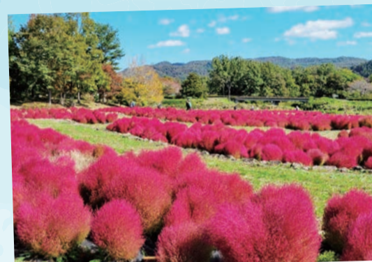
みちのく社の湖畔公園…(川崎町) 真っ赤なコキア、淡く色づいた木々、美しい風景です。 (2023年10月撮影)