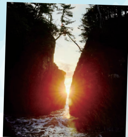
神割崎…(石巻市) 岩と岩の間から昇る太陽は、神々しく神秘的な世界です。 (2023年10月撮影)