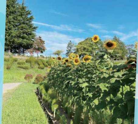
高森公園…(仙台市泉区) ヒマワリが快晴の空へ咲きました。こんな近くに素晴らしい所があることに感謝します。 (2023年8月撮影)