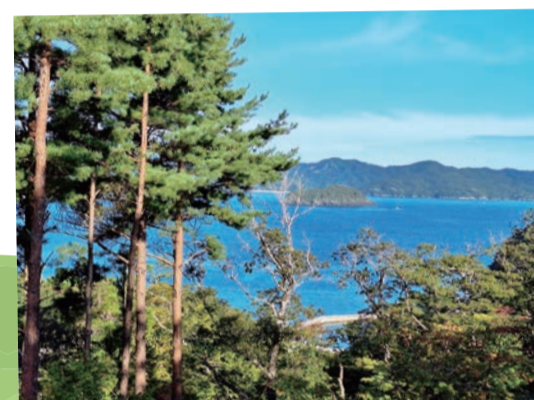
八景島…(石巻市) 雄勝町船越地区と名振地区の真ん中に浮かぶ、大漁豊漁の島!緑の島! (2023年10月撮影)